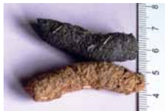
Kotwürstchen von Auerhähnen – Sommerlösung mit Heidelbeerresten (dunkel) und Winterlösung mit Nadelbaumresten (hell).

Beeren. Die Heidelbeeren gedeihen am besten in lückigen Waldpartien, wo die Sonne den Boden aufwärmen und sich ein hohes Insektenangebot entwickeln kann. Neben Heidelbeeren werden aber zahlreiche andere Pflanzen genutzt. So gibt es Vorkommensgebiete, wo Auerhühner auch ohne Heidelbeersträucher ihr Auskommen finden.