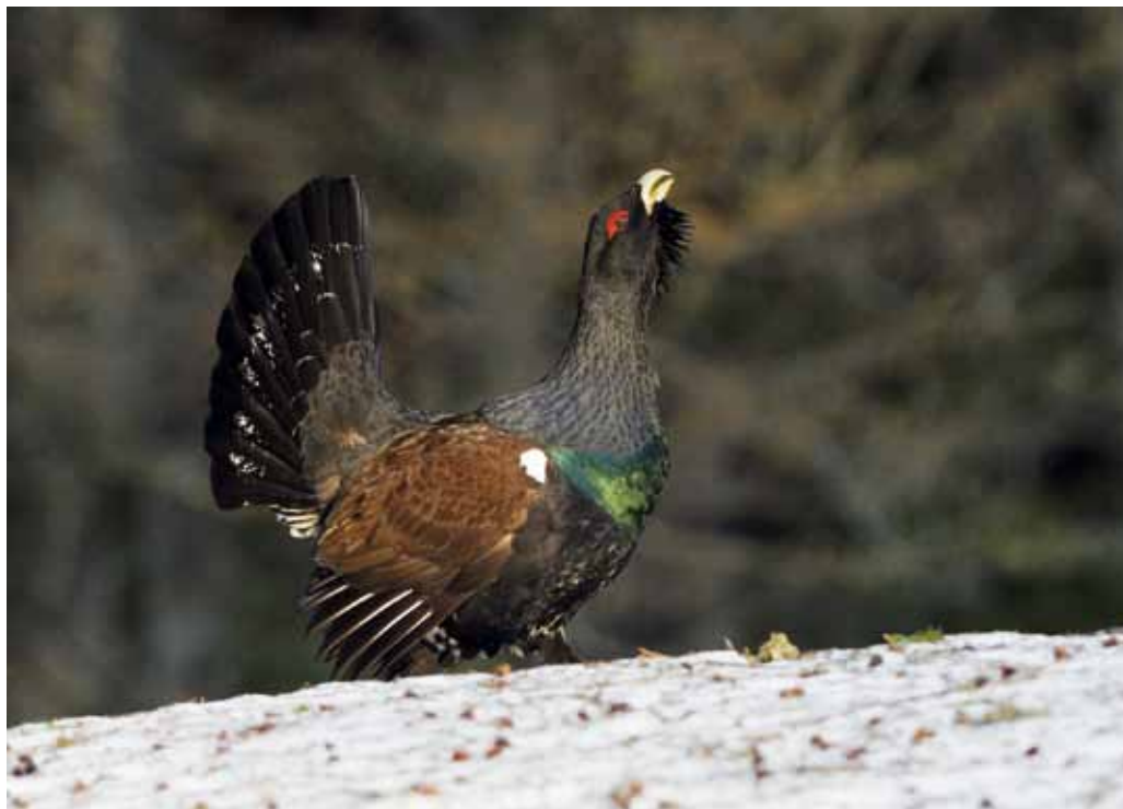
Im Toggenburg sind die Chancen für ein Überleben des Auerhuhns intakt – es liegt an uns.

in grösserem Umfang ist geplant. Allerdings setzt sie eine gute Kenntnis der Wintereinstände und Balzplätze voraus, weshalb sie nur für Spezialisten in Frage kommt.