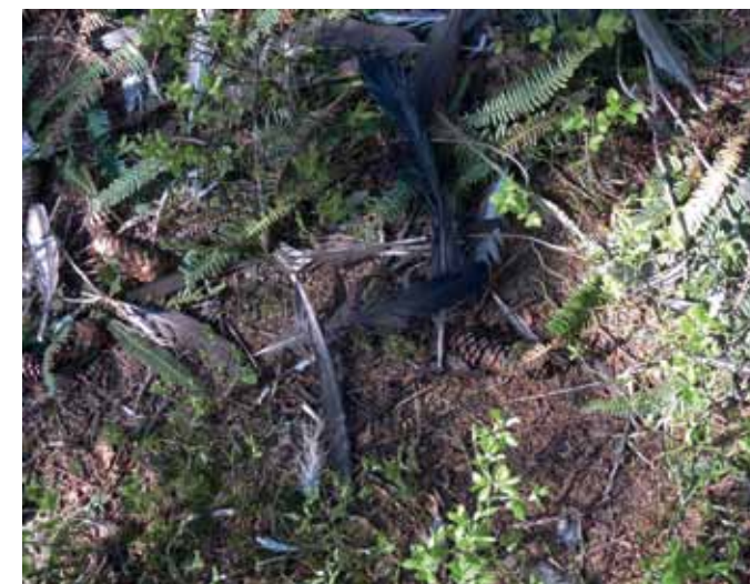
Übriggebliebene Federn eines gerissenen Auerhahnes.

Das Auerhuhn hat zahlreiche Fressfeinde. So gilt es vor allem in der Aufzuchtzeit, gegen Fuchs, Marder, Wildschwein sowie Greifvögel wachsam zu sein. Die führende Henne überwacht ihre Jungmannschaft und warnt beim Auftauchen eines Fressfeindes. Küken, die in dieser Situation rasch lernen, sich sofort unter einen Unterschlupf zu ducken oder auf einen Baum zu retten, überleben eher. Leicht erhöhte Warten wie Baumstrünke oder Wurzelteller helfen der Henne, die Übersicht zu bewahren. Ständige Ortswechsel sind zudem eine weitere Strategie der Henne, Fressfeinden auszuweichen. Bis zum Herbst haben die jungen Auerhühner bereits ein gutes Winterkleid und genügend Gewicht angelegt. Jetzt löst sich der Familienverband auf. Die harte Winterzeit steht vor der Tür. Wenig energiereiche Koniferennadeln als Nahrung müssen bei Schneegestöber und tiefen Temperaturen das Überleben ermöglichen. Sich möglichst wenig bewegen und gut geschützte Plätze unter tief beasteten und eingeschneiten Fichten oder gar eigens angelegte Schneehöhlen aufsuchen hilft, extremen Temperaturen auszuweichen. Gerade in dieser Jahreszeit ist es wichtig, dass die gut versteckten Tiere in Ruhe gelassen werden. Denn häufiges Aufschrecken und Fliehen, sei es wegen hungriger Fressfeinde oder menschlicher Stö-