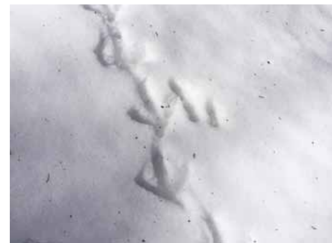
Spuren im Schnee – Trittsiegel eines Auerhahns.

Wie nun sind die genannten bestandesmindernden Faktoren zu werten? Bieten wir dem Auerhuhn in den ausgeschiedenen Lebensräumen tatsächlich genügend grosse und qualitativ hochwertige Aufzuchtgebiete? Sind die Wintereinstandsgebiete optimal? Können die Hühner die menschlichen Störungen räumlich, tageszeitlich und jahreszeitlich verkraften? Halten die Hühner dem erhöhten Feinddruck stand? All diese Faktoren