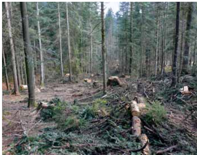
Beispiel eines frisch ausgeführten Holzschlages in Ebnat-Kappel. Mit der Auflichtung des ursprünglich dunklen, geschlossenen Waldes entsteht neuer Lebensraum für das Auerhuhn.

Bemühungen zur gezielten Verbesserung der Auerhuhn-Lebensräume können dank der IAR mit fachlicher Beratung, fallweise auch gepaart mit einer finanziellen Restkostenübernahme, umgesetzt werden. Bis heute konnten so im Gebiet von Wattwil, Ebnat-Kappel, Krummenau und Nesslau, wo nach wie vor Auerhuhnvorkommen bekannt sind, zehn Holzschläge mit insgesamt 4400 Kubikmeter Holz anfall am richtigen Standort und im richtigen Ausmass durchgeführt werden. Weitere Holznutzungen im Ausmass von 2500 Kubikmeter sind im Vernetzungsprojekt Schönenberg in der Gemeinde Wattwil erfolgt. So gab es im Bereich Regulastein-Tanzboden bis zum Speer mehrere systematische Lebensraumaufwertungen, was sicher dazu