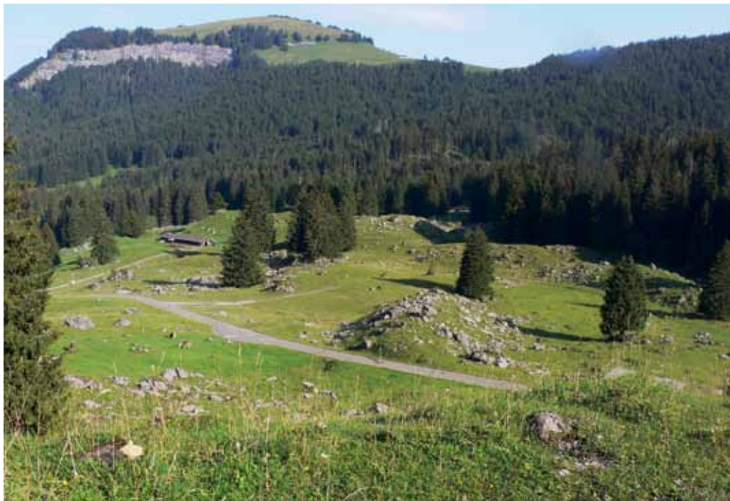
Kreisalpen in Nesslau – Beispiel eines Auerhuhn-Kerngebietes im Toggenburg.