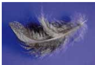
Auerhahnfeder mit gut erkennbarem Afterschaft.

Die Natur hat das Auerhuhn mit Spitzeneigenschaften ausgestattet. Es ist der grösste eurasische Hühnervogel. Der Hahn erreicht ein Gewicht von vier bis fünf Kilogramm, die Henne bloss die Hälfte. Das Auerhuhn beherrscht trotz seinem Gewicht den Blitzstart und das Bremsrütteln. Es kann auf kurze Distanz eine Fluggeschwindigkeit von 95 Kilometer pro Stunde erreichen. Obwohl sein Flug meistens linear verläuft, kann es mithilfe des Schwanzes beim Flug durch den Wald recht geschickte Manöver vollziehen. Als Alternative zu den Zähnen verfügt das Auerhuhn über eine Art Mühle, um die teilweise harte Nahrung zu zerkleinern: Im Magen wird die zähe, holzartige Winternahrung mittels hornartiger Reibplatten und kleiner geschluckter Steinchen zerrieben und anschliessend im über zwei Meter langen Dünndarm mit Hilfe der fast gleich langen Blinddärme wieder aufgeschlossen und verdaut. Die Länge der Darmabschnitte verändert sich mit der jahreszeitlich unterschiedlichen Nahrung. Das Auerhuhn besitzt als Transportsack einen übergrossen Kropf, in welchem der Hahn bis 800 Kubikzentimeter Nadeln von Föhre, Arve, Weisstanne oder Fichte aufnehmen kann. Hier taut die im Winter oftmals noch eisbedeckte Nahrung auf und wird durch Sekrete der Kropfdrüsen aufgeweicht. Nach