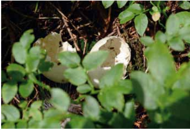
Zufallsfund – Eierschalen eines Auerhuhngeleges.